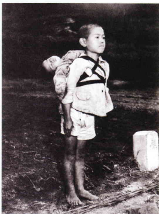
ジョー・オダネル「焼き場に立つ少年」